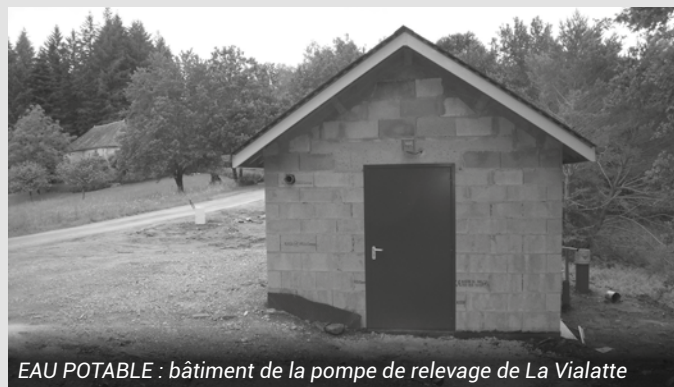
EAU POTABLE : bâtiment de la pompe de relevage de La Vialatte